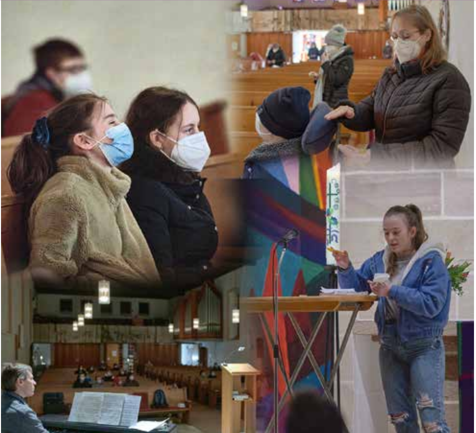
Gemeinschaft in Wort und Sakrament